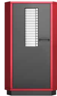
StoreManager PRO 2160 Master